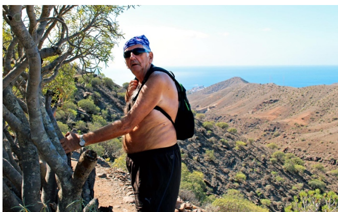
På fjelltur på Kanariøyane i 2017.