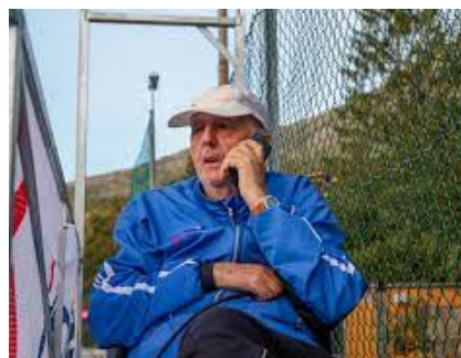
I felten.